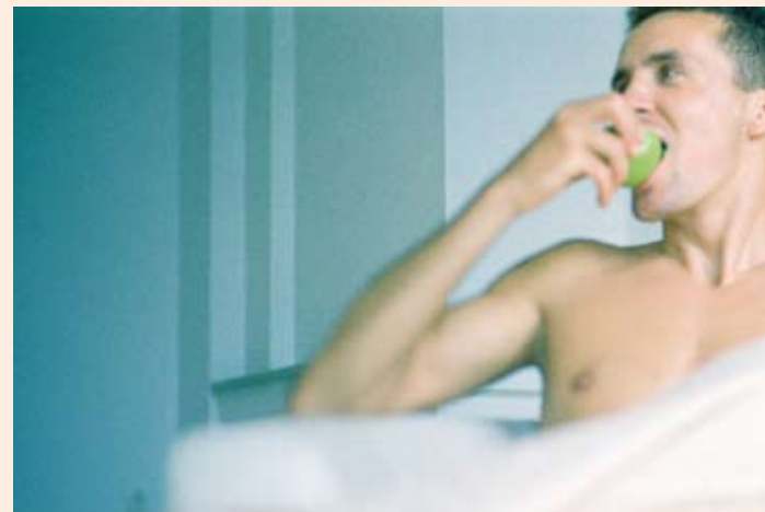
Topo Hydrogellinsen - für zufriedene Kunden!